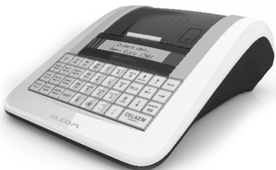
Euro-150TEi Flexy CZ