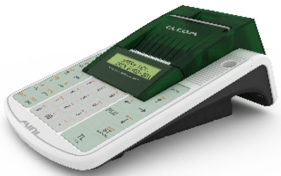
Euro-50TEi Mini CZ